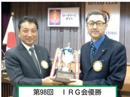
第98回 I R G会優勝